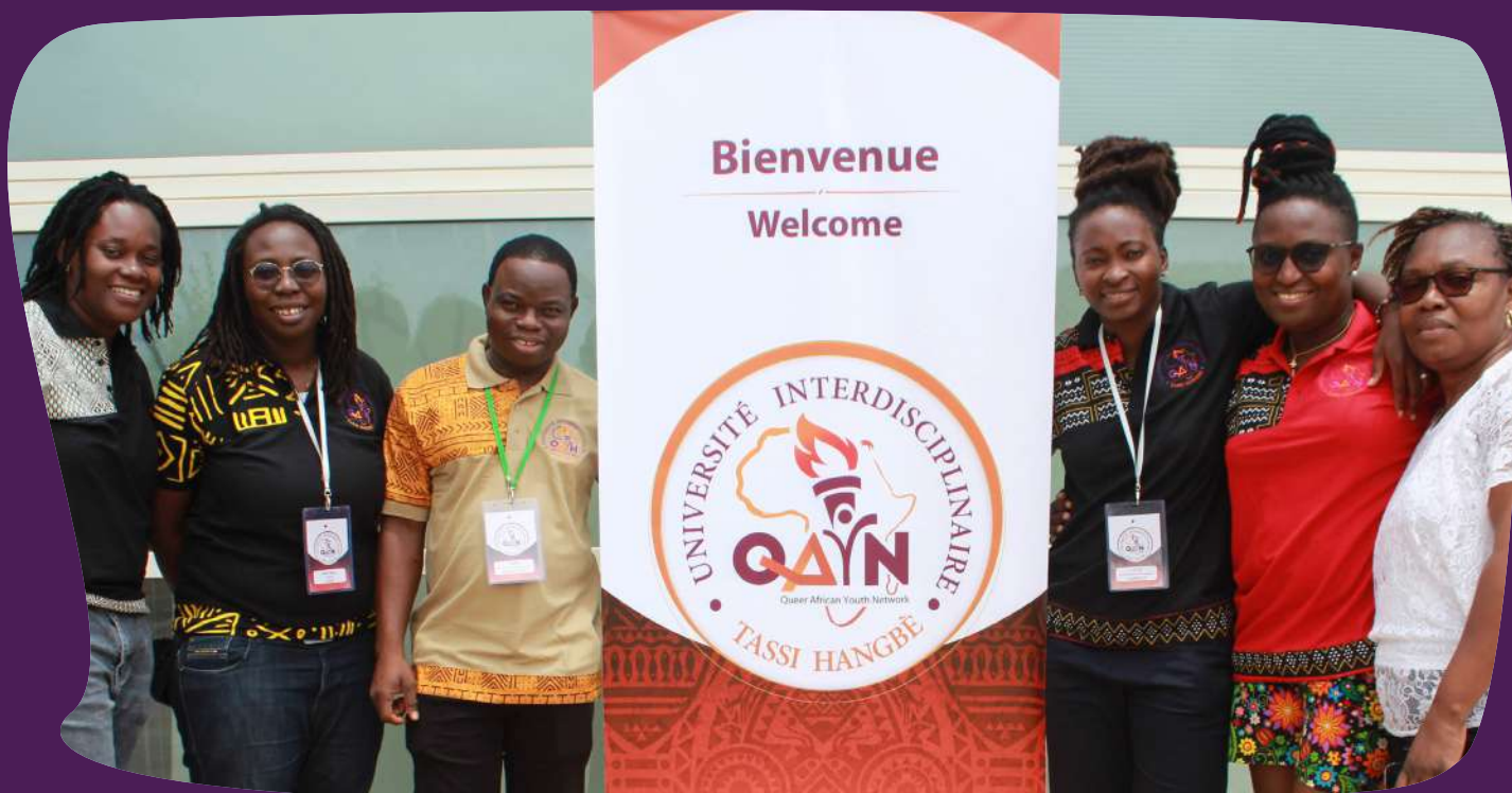
Conseil des Conseillères, Responsables Pédagogiques et les Co-Coordonnatrices