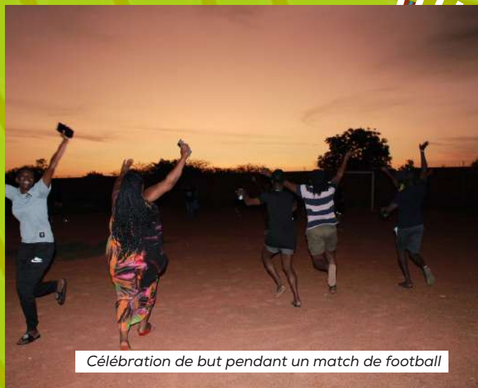
Célébration de but pendant un match de football

Dans le souci du bien-être et de la santé mentale de toutes les personnes participant à l'Université, un programme culturel très riche a été élaboré. Les activités avaient pour but non seulement d'offrir des espaces de respiration et de détente, mais aussi de stimuler la réflexion et de se connecter autant avec l'environnement qu'avec les autres. Au total, il y a eu plusieurs séances de natation, de foot, de théâtre, de chant, d'art thérapie, de yoga et de danse. Un atelier d'écriture a aussi eu lieu et a suscité l'intérêt de beaucoup de participantEs et des membres de l'équipe pédagogique.