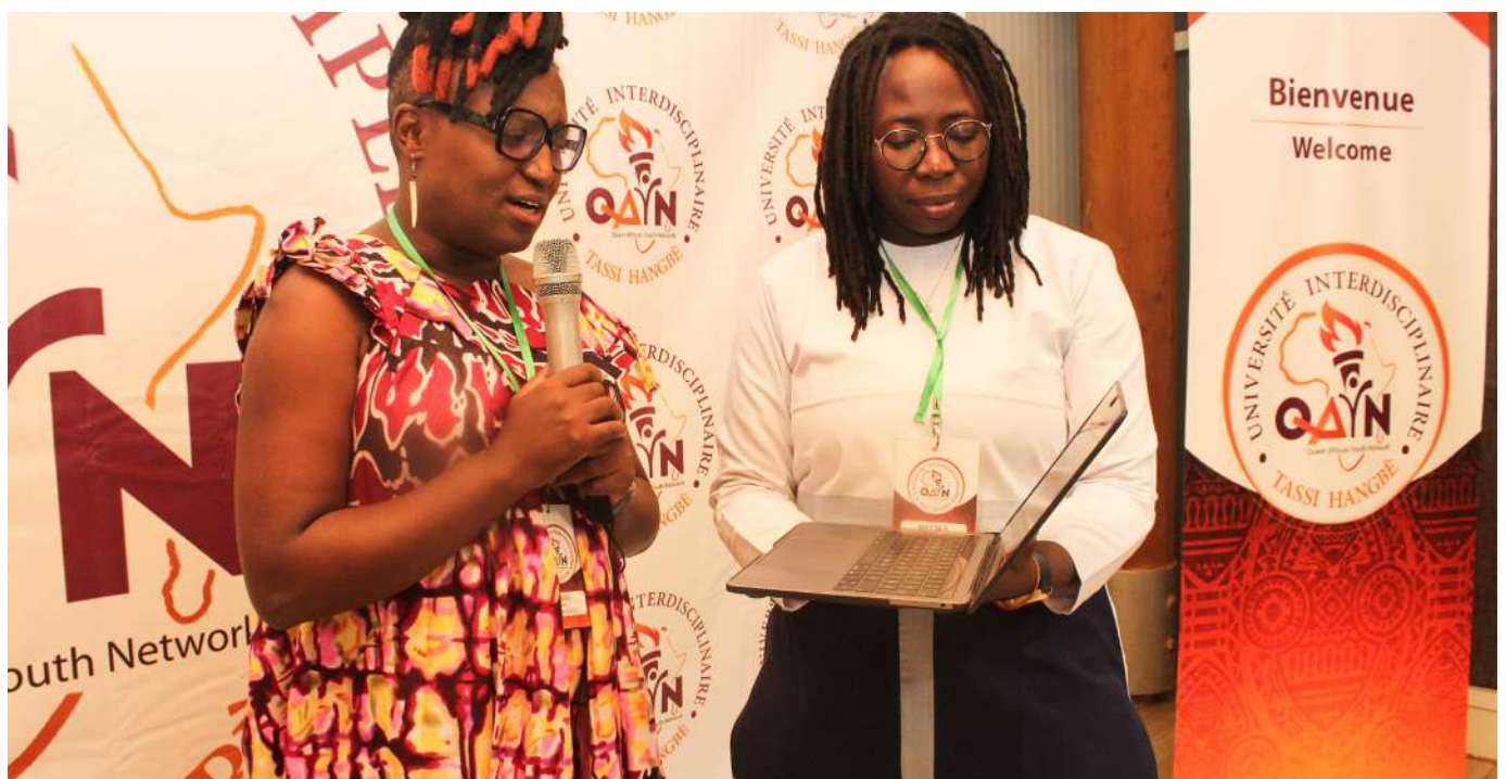
Mots d'ouverture des Co-Coordonnatrices

Pendant une période de trois semaines se sont succédées activités de formation, activités de sport et culture, sorties touristiques et moments de repos, le tout dans un cadre sécurisé et encadré par une équipe médicale très active.