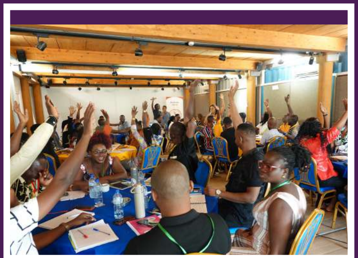
Cours du Module 1

Chaque module était structuré entre 3 et 5 unités d'enseignement, lesquelles étaient préparées sur power point et mis à la disposition des apprenantEs sur drive. La liberté a été laissée aux intervenantEs d'évaluer le niveau de connaissances acquis. Priorité a été donnée à la méthode participative et à une utilisation optimale de l'espace extérieur, de même que des ressources existantes dans l'équipe d'organisation.